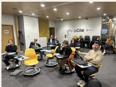
Les participants en présentiel

Les 25 participants ont exploré l'utilisation de l'IA dans les outils marketing, découvrant ainsi des stratégies novatrices pour propulser la croissance de leurs entreprises 🚀